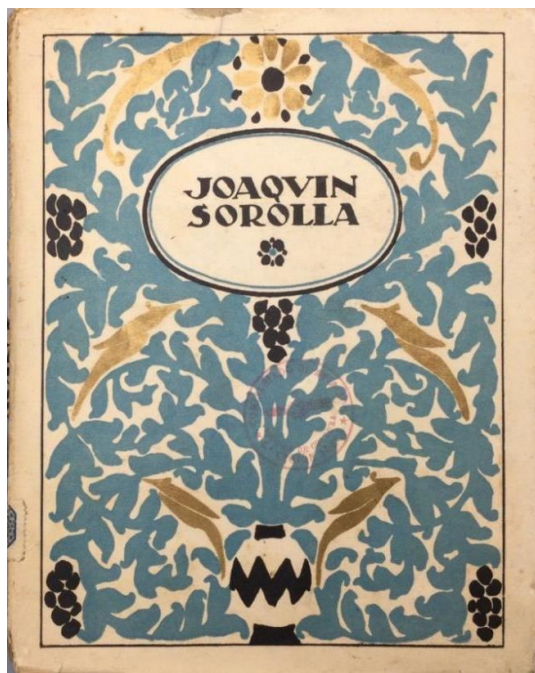
Portada de la edición del libro de Aureliano Beruete, Madrid, 1920.